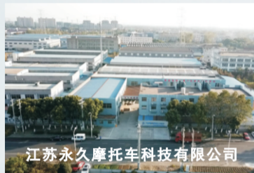
江苏永久摩托车科技有限公司

的生产工艺标准,专研两轮电动摩托车、两轮电动自行车,致力于打造品质卓越、价格亲民的工具,以满足不同消费者的需求。