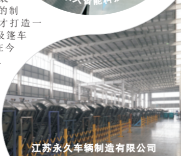
江苏永久车辆制造有限公司