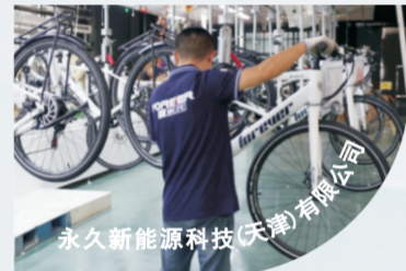
天津新能源科技(天津)有限公司

2022年4月成立了永久新能源科技(天津)有限公司,集设计、开发、生产电动自行车于一体,大力发展新能源产业,主要产品有山地型电动自行车,城市休闲型电动自行车公路型电动自行车等,为绿