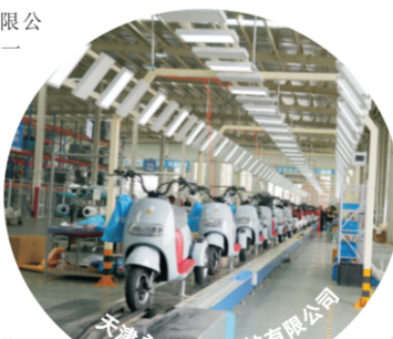
天津新能源科技(天津)有限公司