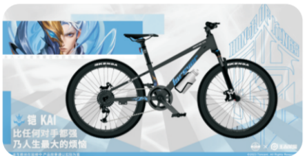
永久×王者荣耀合作款自行车——铠,一键切换形态,纵横骑行之路。

作为本次亚运会正式金牌项目、腾讯旗下经典手游、游戏日活超1亿传奇、国内TOP排行游戏,永久本次与王者荣耀强强联合,热度火爆,上线之后掀起一股购买热潮!永久在以往已经与国内多家知名游戏大厂,如网易、腾讯、完美世界等达成良好的合作伙