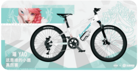
永久×王者荣耀合作款自行车——瑶,鹿灵轻巧,颜值与实力并存。