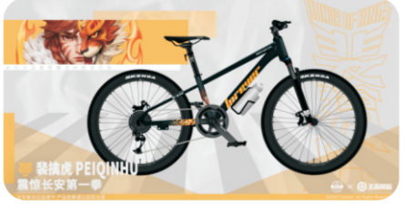
永久×王者荣耀合作款自行车——裴擒虎,狩猎之虎,蓄力每一次出行。

在为期3日的浙江展中,永久携众多前沿科技产品参展交流,促进行业和企业升级,融合创新助力可持续发展!永久品牌号召力、展出影响力都刷新往届,展位吸引了众多来访者,人流攒动,合作洽谈者众多,彰显品牌实力!无锡展上,永久携全新国标车以及超级魔九代、B11、A1等外贸车悉数亮相,新潮外观设计与硬核的性能配置牢牢吸引着往来客商的目光,海外经销商对永久产品赞不绝口,对永久品牌百分百信赖,直接现场洽谈签约!永久作为中华老字号品牌以强大的品牌号召力、产品创新力和科技制造力,令经销商们热情高涨,争相代理!