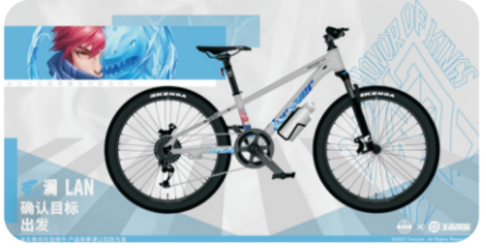
永久×王者荣耀合作款自行车——澜,鲨鱼潜行,体验劲爽速度。